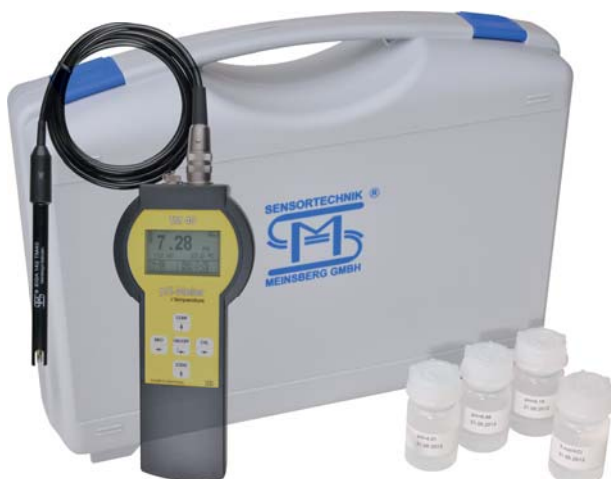
TM 40/Set mit pH-Sensor EGA 142/TM 40 TM 40/Set with pH Sensor EGA 142/TM 40