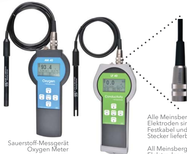
Sauerstoff-Messgerät Oxygen Meter